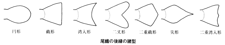
尾鰭の後縁の諸型