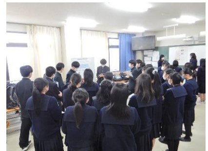
プロジェクト探究Ⅰ発表会